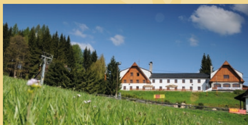
Ski areál Kopřivná

rovněž přispějí ke zvýšení zaměstnanosti o 96 pracovních míst.